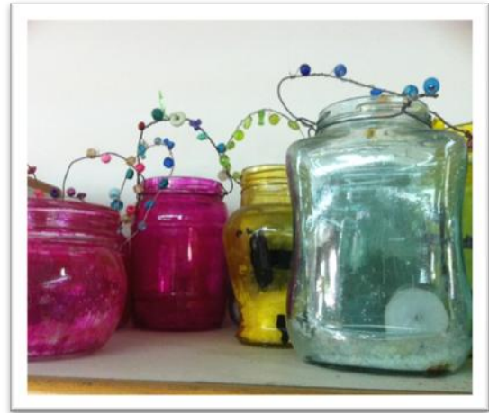
העששיות היפהפיות הן צנצנות ממוחזרות, צבועות בצבעי זכוכית. הידית עשויה מחוט ברזל עבה. החרוזים מלופפים עליו בעזרת חוט מתכת דק. מומלץ לשפוך מעט מלח גס לצנצנת כדי לשמור שלא תתפוצץ