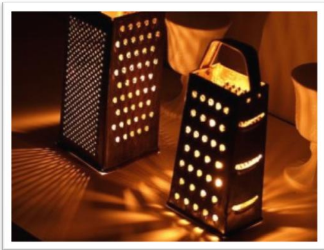
זה מה שנקרא רב שימושי. אחרי שגירדנו תפוחי אדמה ללביבות למה שלא נדליק בהן נרות...