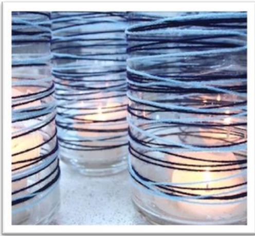
תראו מה חוטי צמר פשוטים יכולים לעשות...