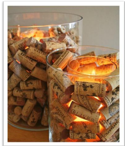
אז תתחילו לאסוף את הפקקים...