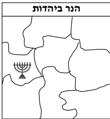
דוגמא ללוח פאזל