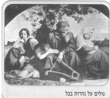
גולים על נהרות בבל