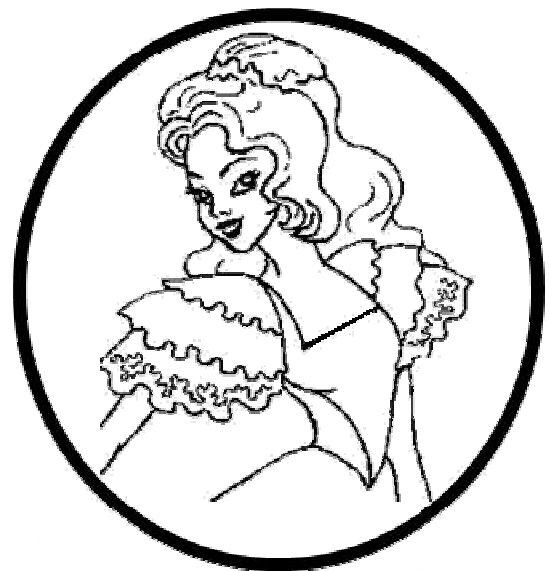
רעיון לחובקי מפיות