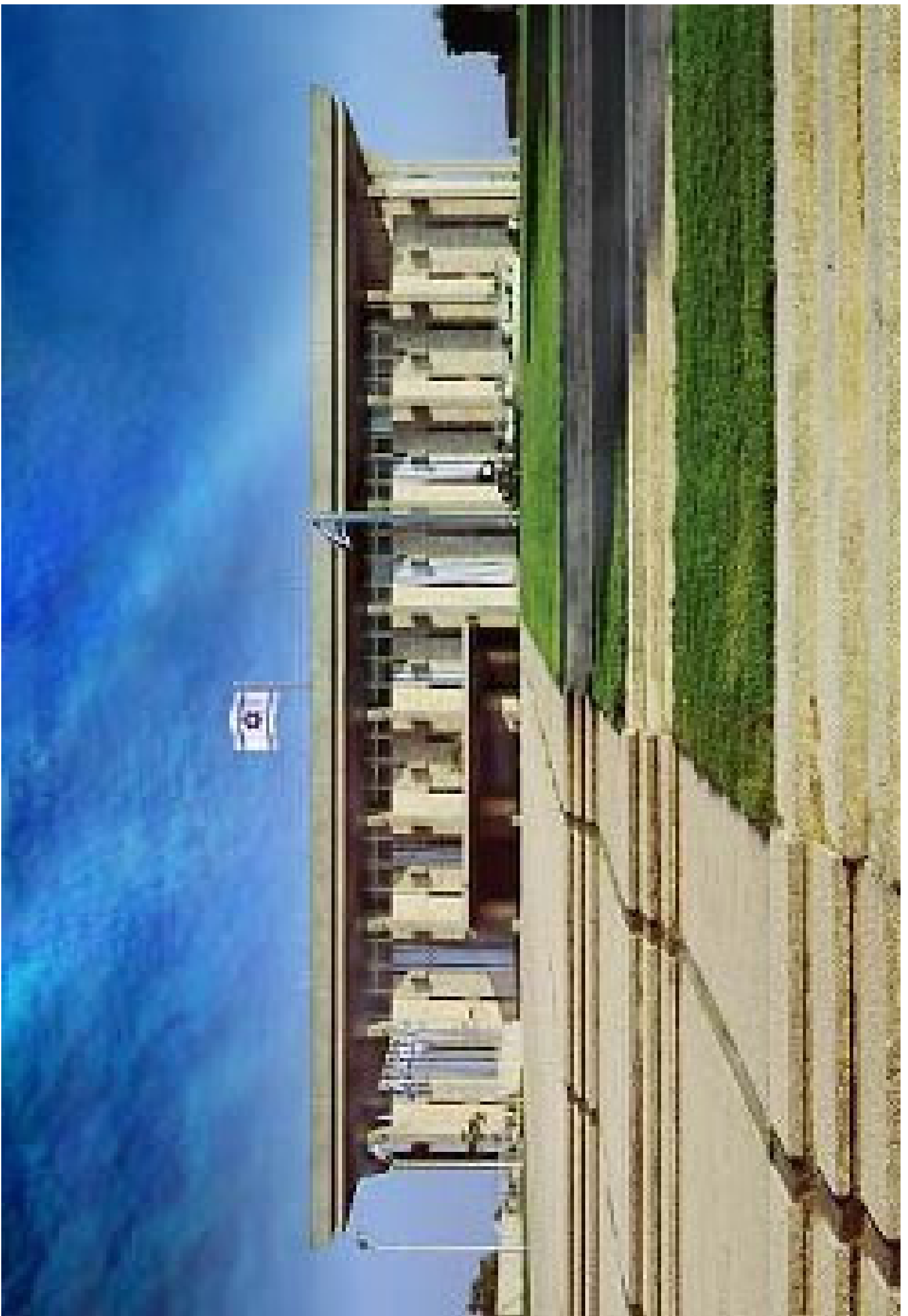
©"ילדים בסיני – המועצה לילד החוסה", המרכזיה החינוכית ב"אחוזת שרה"