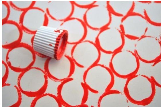
חותמת עם פקק של בקבוק: