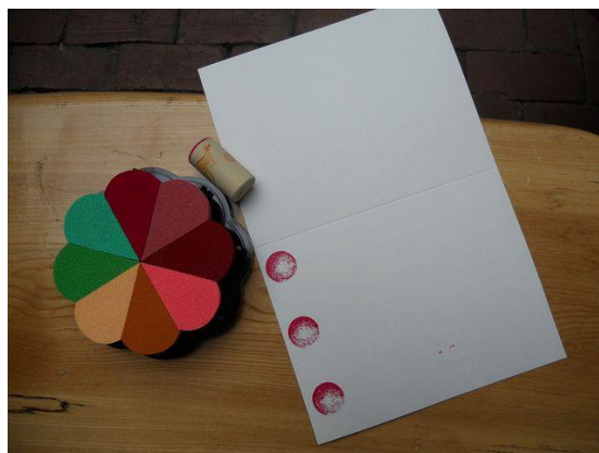
חותמת עם פקק שעם: