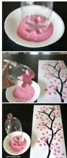
חותמת עם תחתית של בקבוק קנול: