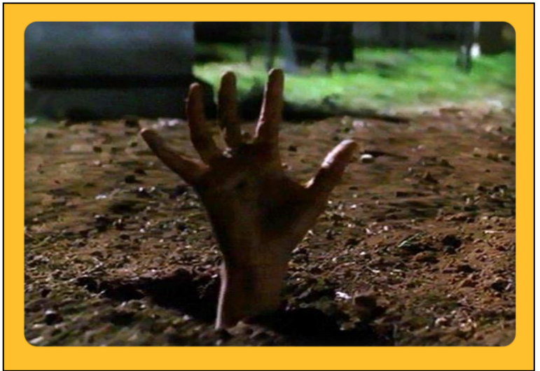
הטוב, הרע והלא נודע