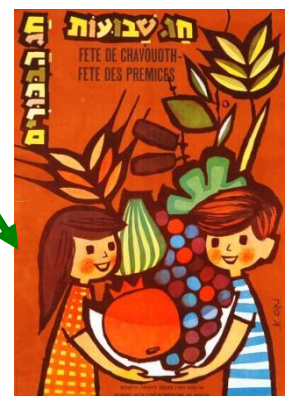
כרזה של קק"ל לשבועות, עיצוב: נגה אדלר