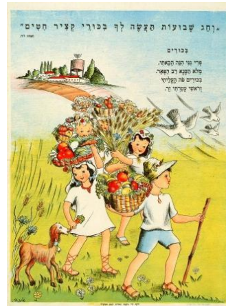
כרזה לשבועות של מועצת המורים למען הקק"ל, 1950.

חג השבועות ציין בתקופת המקרא את תחילת עונת הקציר והבאת הביכורים לבית המקדש. לפי המסורת, חג השבועות הוא גם היום שבו ניתנה התורה לבני ישראל. היישוב היהודי המתחדש שמח לאמץ את החג החקלאי ולצקת לו תוכן מתאים. הקיבוצים, המושבים והכפרים נהגו לערוך טקסים מרשימים של הבאת סלסילות עם פירות, ומופעים של שירה וריקודים לכבוד החג. הנה כמה כרזות שמייצגות את חג השבועות בתקופות שונות.